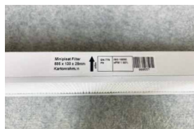
Danach den F9 Filter darauflegen