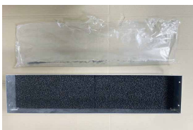
Nach dem Entfernen der Folie zuerst die Aktivkohle in die Ausblaskassette legen