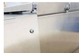
Dann die Ausblaskassetten wieder befestigen