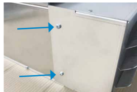
Insgesamt 8 Schrauben auf beiden Seiten an beiden Ausblaskassetten mit einem Kreuzschlitz Schraubendreher öffnen