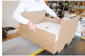
Gerät mit Innenkarton herausnehmen