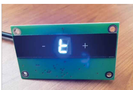
Wenn diese Fehlermeldung erscheint, sind die Filter nicht richtig eingebaut