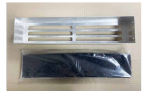
Folie von der Aktivkohle entfernen